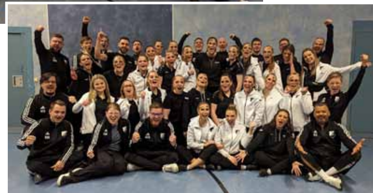
Neue Trainingsanzüge! Danke an die Sponsoren Dornburg Reisen und H&R Schneidservice