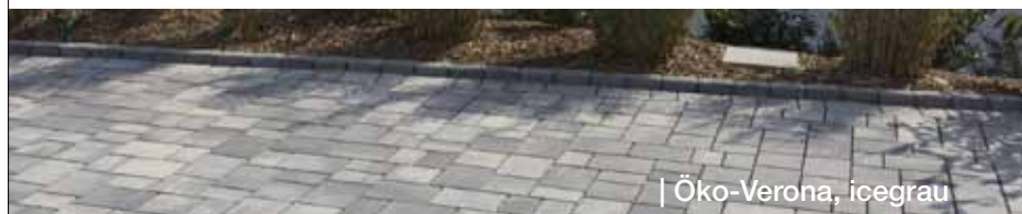
| Öko-Verona, icegrau

Dorfplatz Weroth | Elegantes Ambiente und einladende Gemütlichkeit