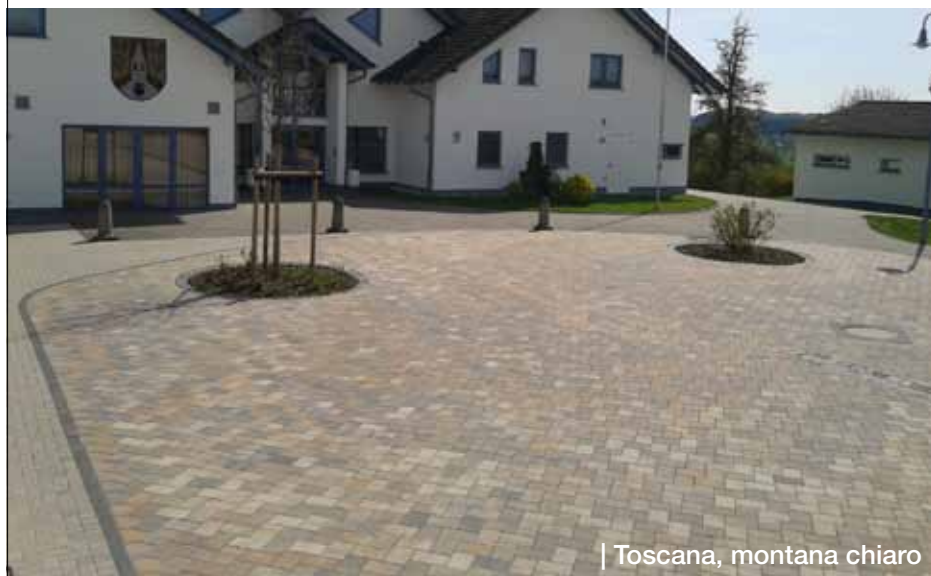
| Toscana, montana chiaro

Dorfplatz Weroth | Elegantes Ambiente und einladende Gemütlichkeit