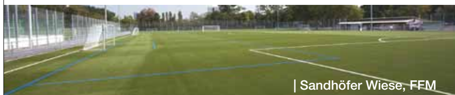
| Sandhöfer Wiese, FFM

Betonwerke | Betonsteine | Betonplatten | Gartenelemente